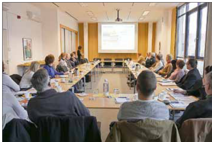
Die LWG hatte im März Landwirte und Behörden aus ihrem Versorgungsgebiet zu einer Informationsveranstaltung eingeladen.

Hinweise zu diesem Thema findet man jederzeit auch auf der LWG-Website www.lausitzer-wasser.de . Die Lage der Trinkwasserschutzgebiete können unter http://maps.brandenburg.de/apps/Wasserschutzgebiete oder auf den Geoportalen der Stadt Cottbus oder der Landkreise eingesehen werden.