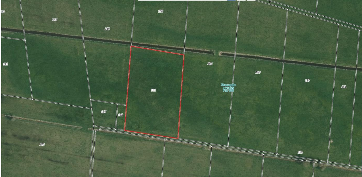
Luftbild des Flurstückes