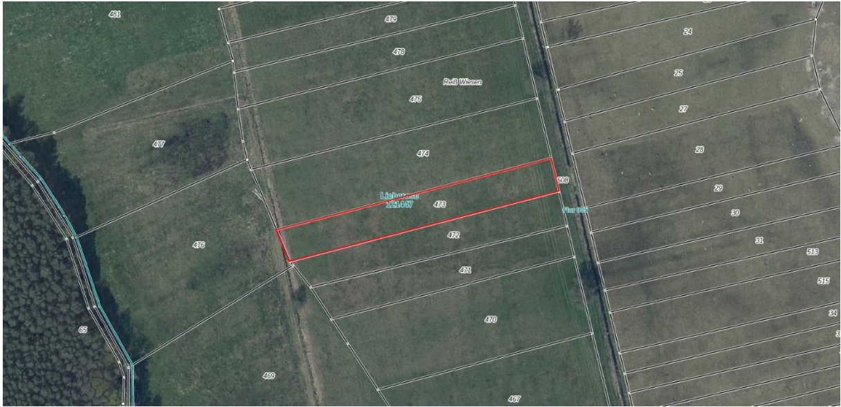
Luftbild des Flurstückes