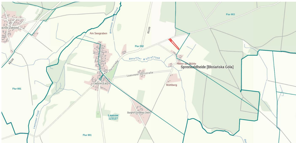
Lage der Flurstücke

Anfragen zum Grundstück werden unter Tel.-Nr.: 035475/863 53 beantwortet.