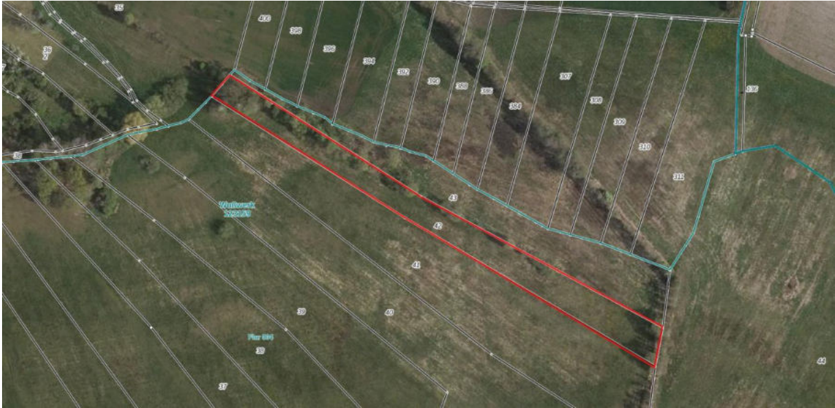
Luftbilder der Flurstücke