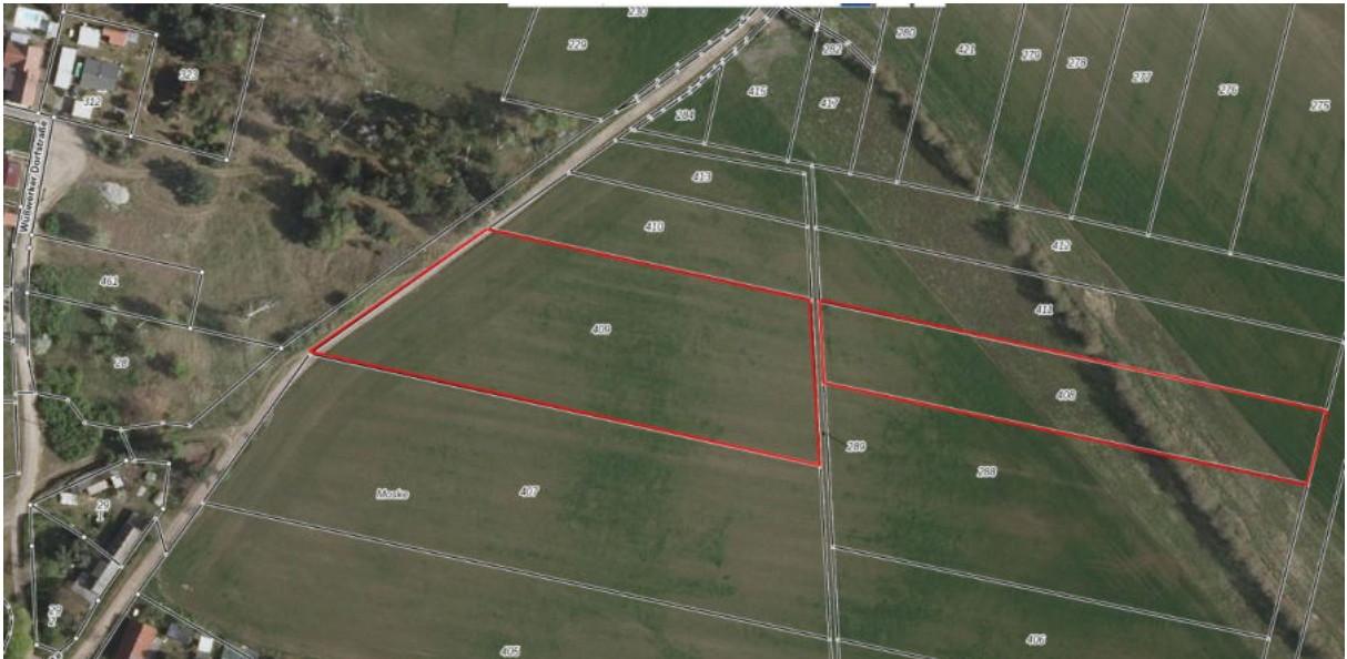
Luftbilder der Flurstücke