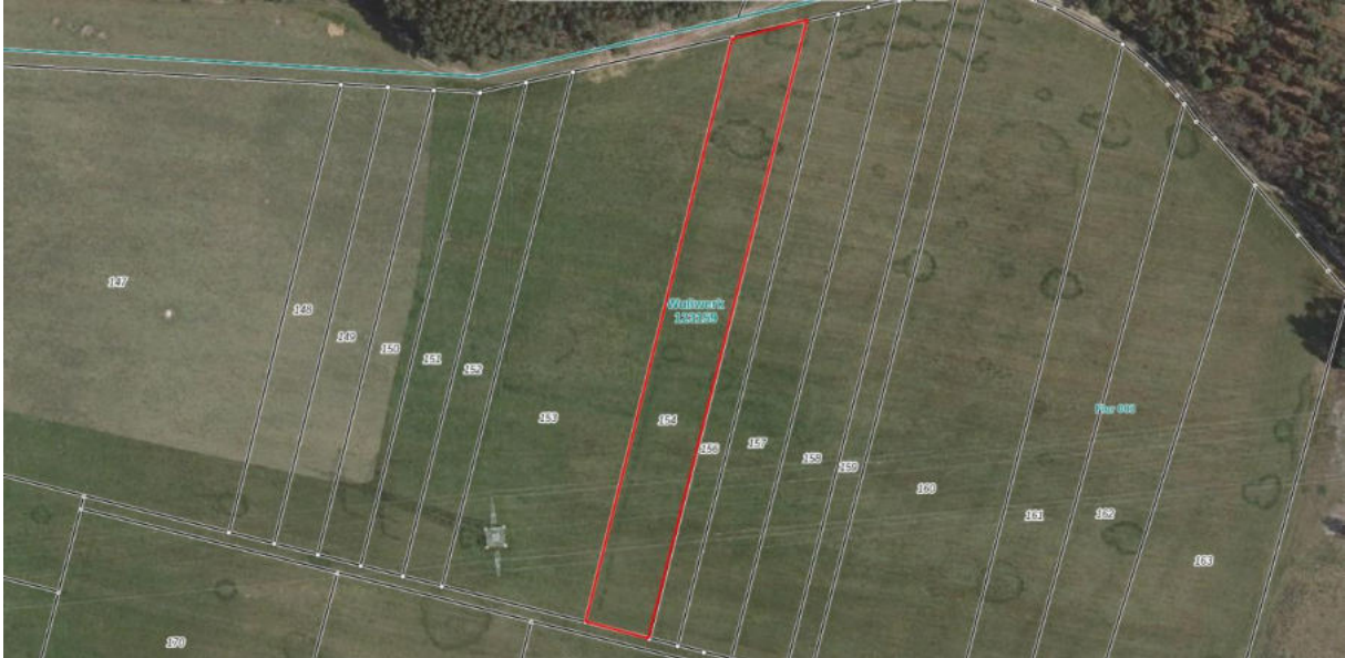
Luftbilder der Flurstücke