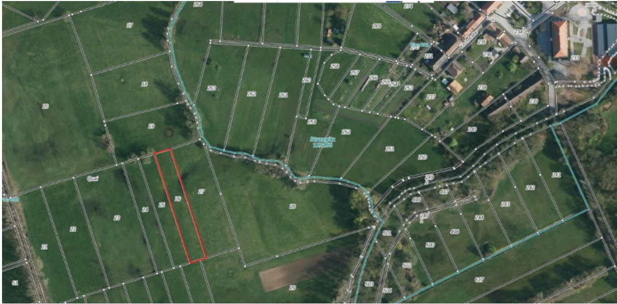
Luftbild des Flurstücks