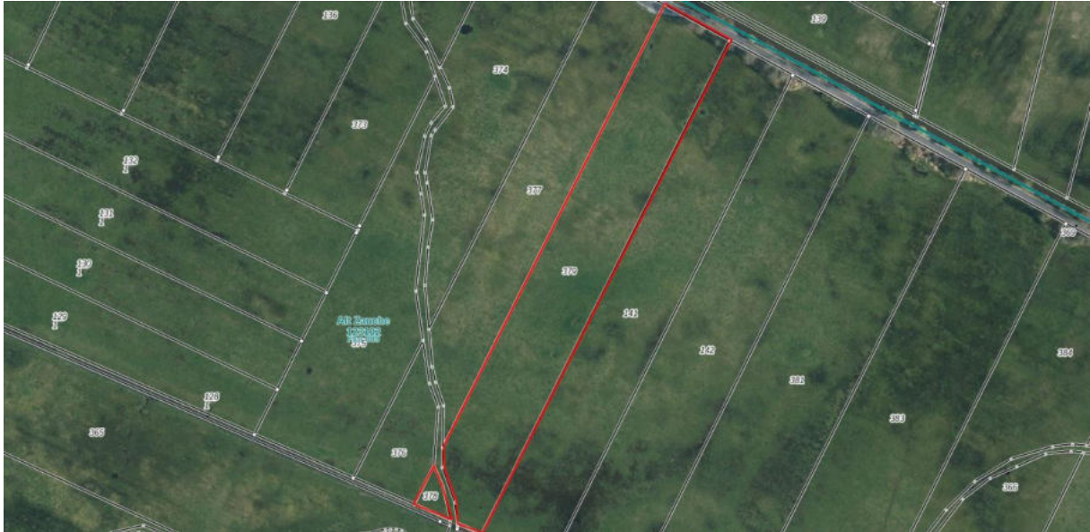
Luftbild der Flurstücke