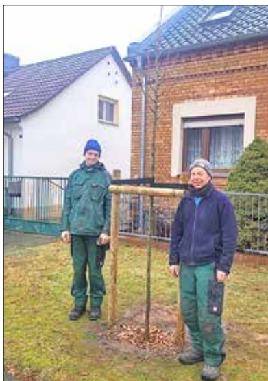
Die Firma Welzel führte die Pflanzungen und Stabilisierung der Bäume professionell und zur Zufriedenheit aller aus.