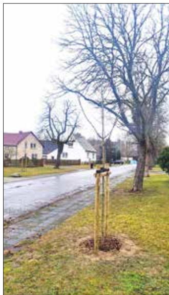
Mit den neuen Bäumen kann der typische Alleencharakter wieder z.B. entlang der Dorf- und Hauptstraße wieder hergestellt werden.