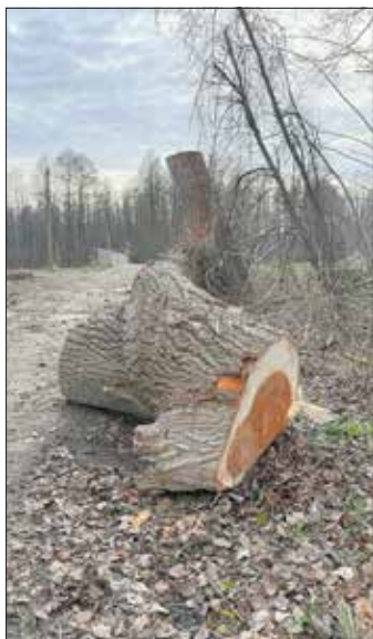
An der Schützenhausbrücke hatte eine große Pappel eine gefährliche Schiefelage, deshalb wurde sie gefällt.

In den letzten Jahren und auch in den vergangenen Wochen mussten kranke und abgestorbene Bäume, die eine Gefahr für die Menschen darstellten, abgeholzt werden. Um die Natur zu stärken, aber auch das Dorfbild mit seinen Alleen wieder herzustellen, wurde Anfang Dezember nachgepflanzt. Insgesamt 22 junge Bäume stehen jetzt in den Ortsteilen von Alt Zauche (Dorfstraße, Hauptstraße, Mühlweg und Siedlungsstraße) und Burglehn (Straße Richtung Wußwerk und Park). Es handelt sich um Sommerlinden, Rotkastanie, Ahorn und Eschen. Weitere Pflanzungen sind geplant, wie beispielsweise im Frühjahr zwei Weißdornbäume. Die Auswahl der Standorte erfolgte in Abstimmung zwischen der Gemeindevertretung und dem Amt, es wurden nur Gemeindeflächen ausgewählt. Die Pflanzung führte die Fa. Welzel aus. In einigen Jahren werden die neuen Bäume an heißen Tagen sicher Schatten spenden und für eine gute Luft sorgen. Die Gemeinde würde sich freuen, wenn engagierte Anwohner eine Patenschaft für die frisch gepflanzten Bäume übernehmen, damit Linden und Co. gut anwachsen und gedeihen. Wer dabei Unterstützung wünscht, kann sich gern auch an die Gemeindevertretung wenden.